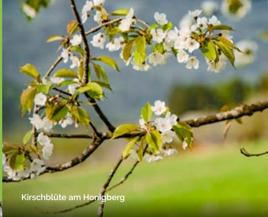
Kirschblüte am Honigberg