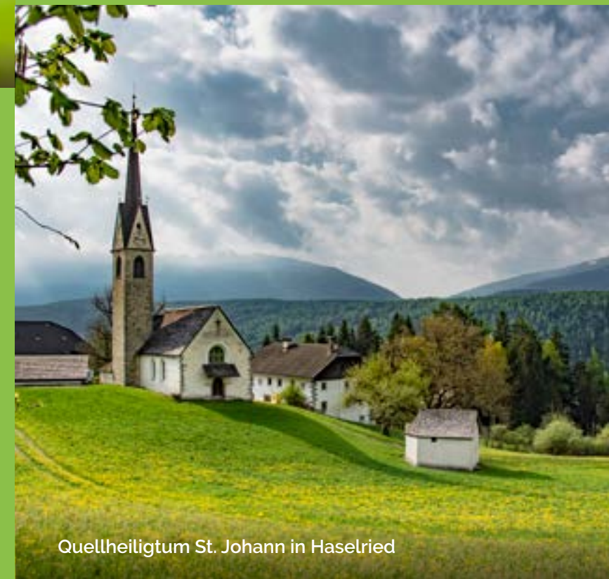
Quellheiligtum St. Johann in Haselried

The name Collina del Miele-Honigberg, which translates as "honey hill", refers to the area between Haselried and Falzes-Pfalzen. The name comes from the hillside's sunny location which makes it ideal for bee-keeping and making honey.