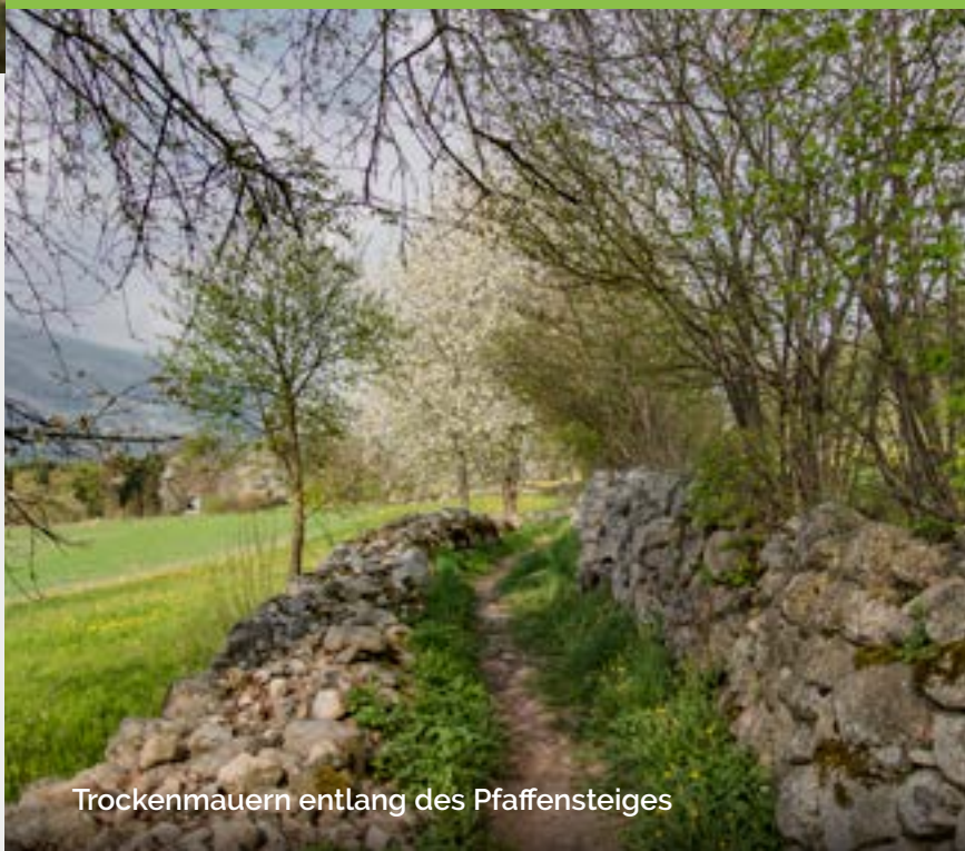
Trockenmauern entlang des Pfaffensteiges

Der Honigberg umfasst das gesamte Gebiet zwischen Haselried und Pfalzen oberhalb der Straße nach Terenten. Der Flurname „Honigberg“ beschreibt den sonnigen Hang, der sich ausgezeichnet für die Bienenzucht eignete und eine äußerst reiche Honigproduktion ermöglichte.